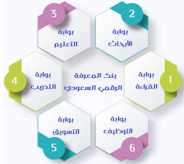
الشكل (٢) محتوى بنك المعرفة الرقمي السعودي

السعودي المقترح على مصادر المعرفة لمختلف الاهتمامات من أكبر دور النشر، والإنتاج العلمي، وبيوت الخبرة المتخصصة، ويرتكز محتوى بنك المعرفة الرقمي السعودي المقترح على ست بوابات معرفية كما في الشكل (٢):