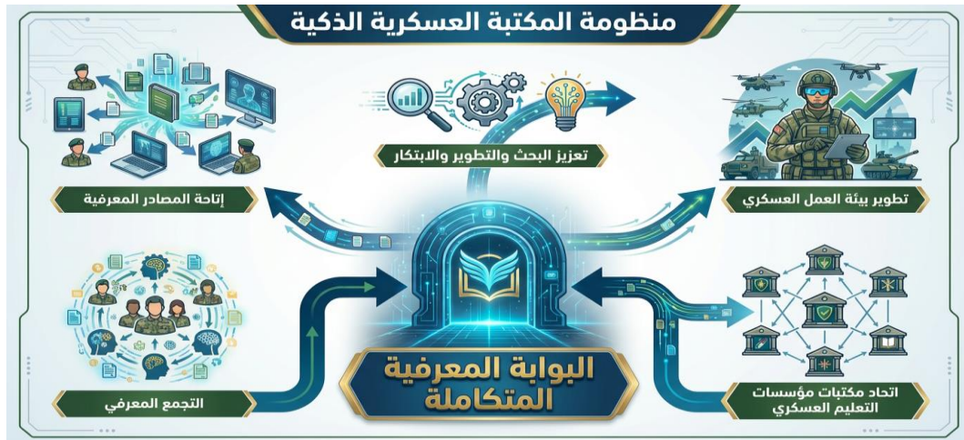
شكل (٣) منظومة المكتبة العسكرية الذكية

يتبين مما سبق ذكره أن التحول من المكتبة التقليدية إلى المكتبة الذكية يمثل نقلة نوعية أساسية تتماشى مع عصر المعرفة والتنمية المستدامة، ويضمن تقديم خدمات مكتبية مبتكرة وفعالة للمستخدمين. ويمكن ذلك من خلال تصميم