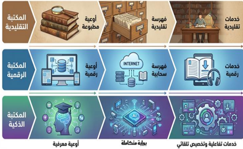
شكل (٢) مراحل التحول إلى المكتبة العسكرية الذكية